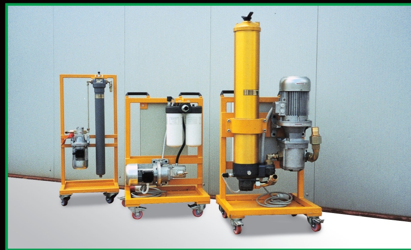
IMPIANTI DI FILTRAGGIO