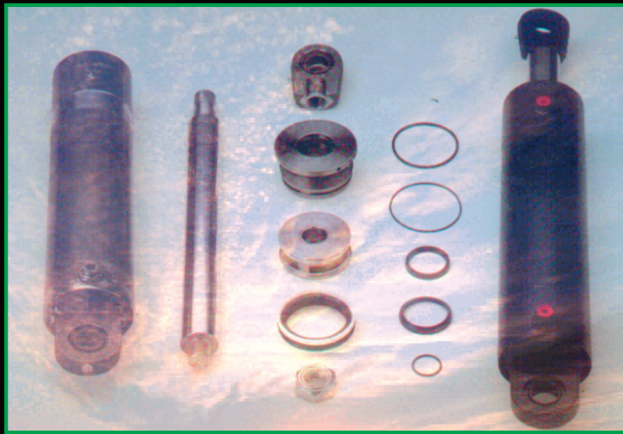
COMPONENTI PER CILINDRI